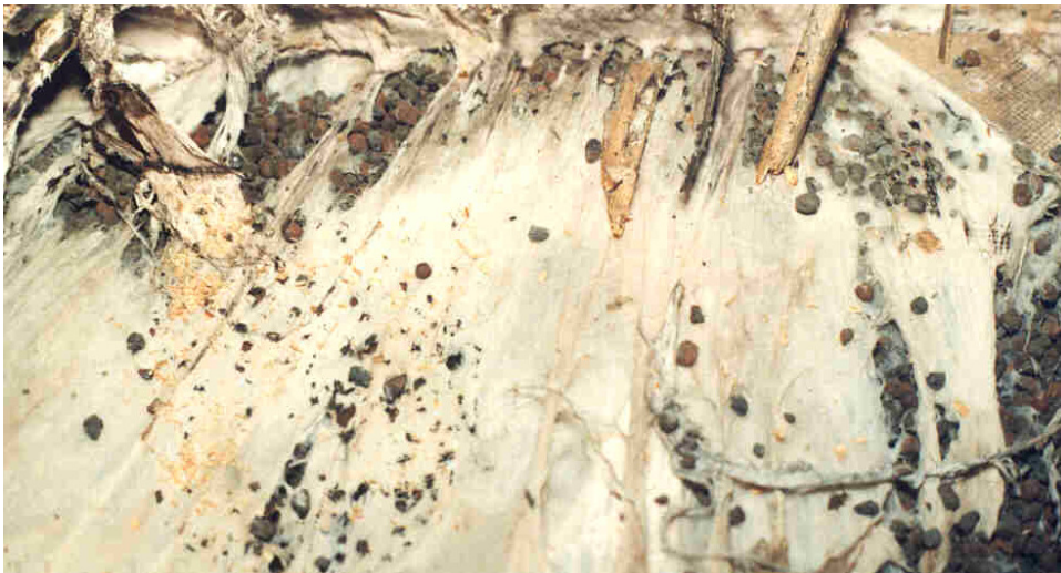
Stränge des echten Hausschwammes.