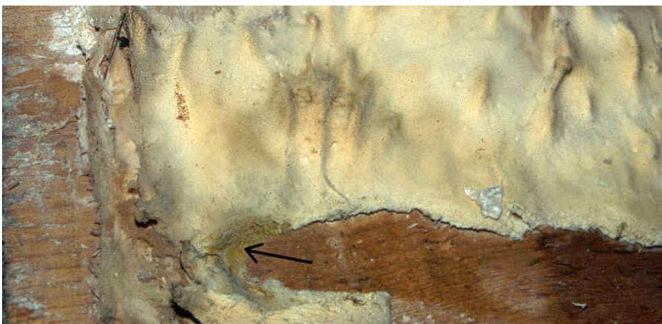
Altes Myzel des echten Hausschwamms.