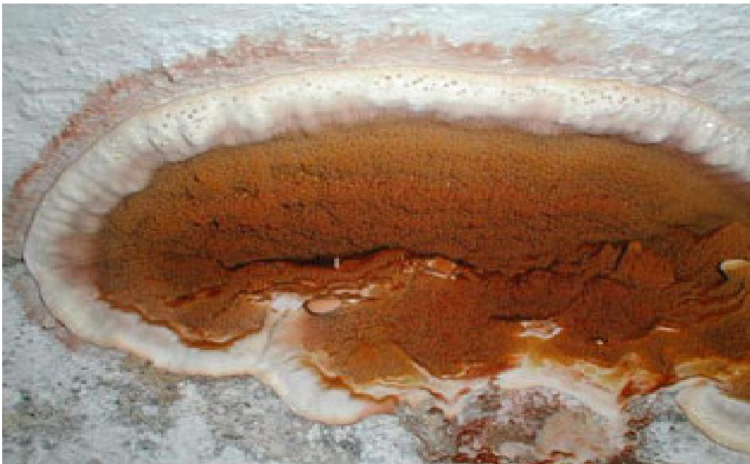
Fruchtkörper des echten Hausschwammes Farbe: kräftig Orange mit einem wattigen weißen Rand

Aus den Gründen der starken Zerstörungskraft dieses Schwammes ist in vielen Bundesländern der echte Hausschwamm (noch) meldepflichtig. Bitte erkundigen Sie sich hier bei ihrer zuständigen Behörde (Bauaufsicht) oder setzen Sie sich mit einem Sachverständigen Ihres Vertrauens in Verbindung.